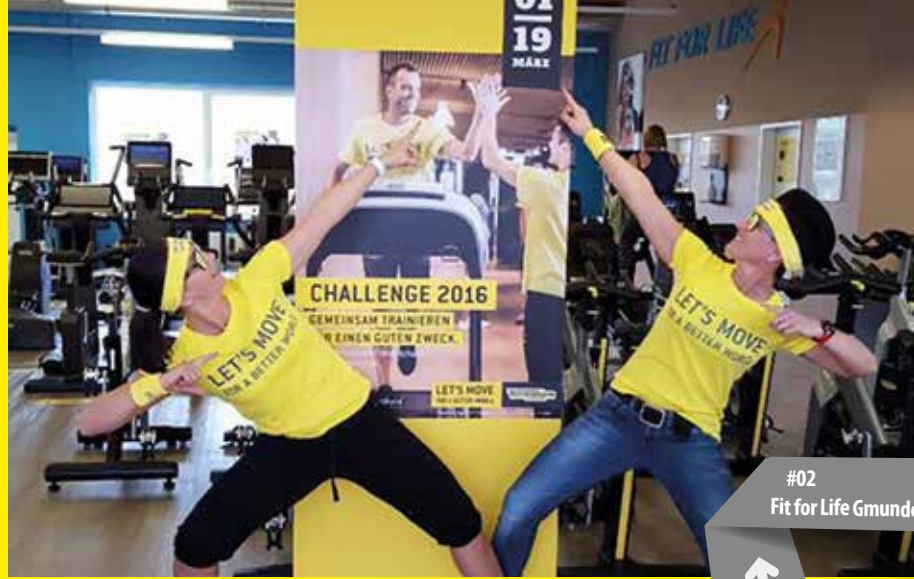
#02 Fit for Life Gmunden