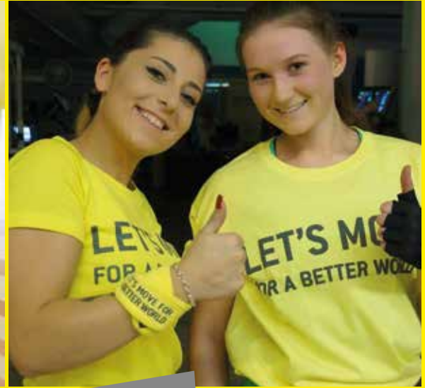
#06 Life Fitness