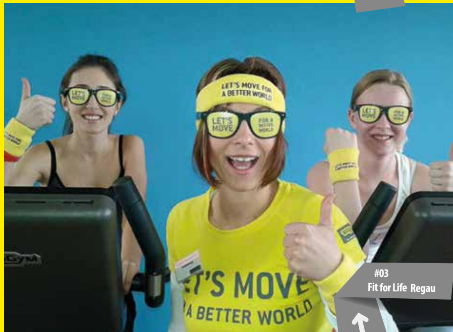
#03 Fit for Life Regau