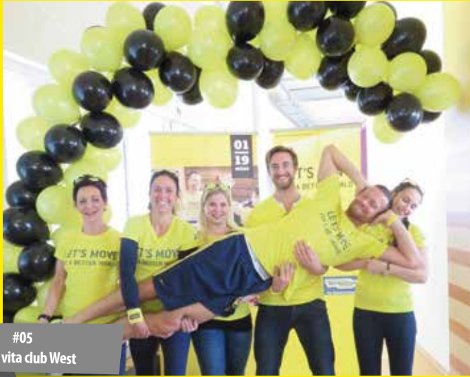
#05 vita club West